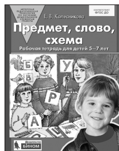
«Предмет, слово, схема». Рабочая тетрадь для детей 5–7 лет