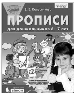
«Прописи для дошкольников 6–7 лет»