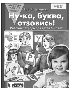
«Ну-ка, буква, отзовись!» Рабочая тетрадь для детей 5–7 лет