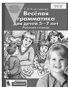
«Веселая грамматика для детей 5–7 лет». Рабочая тетрадь