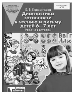
«Диагностика готовности к чтению и письму детей 6–7 лет». Рабочая тетрадь